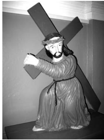
Šv. Luko atleidai yra gerai, bet daug svarbiau kantriai ir garbingai nešti savo gyvenimo kryžių.