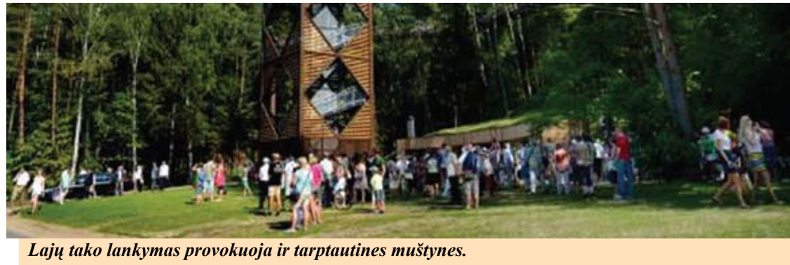
Lajų tako lankymas provokuoja ir tarptautines muštynes.

Šeštadienį Anykščiuose, šalia prekybos centro „Maxima“, kilo masinės muštynės, kurių metu nukentėjo Latvijos Respublikos pilietis. Latviai buvo atvykę pasižiūrėti Medžių lajų tako.