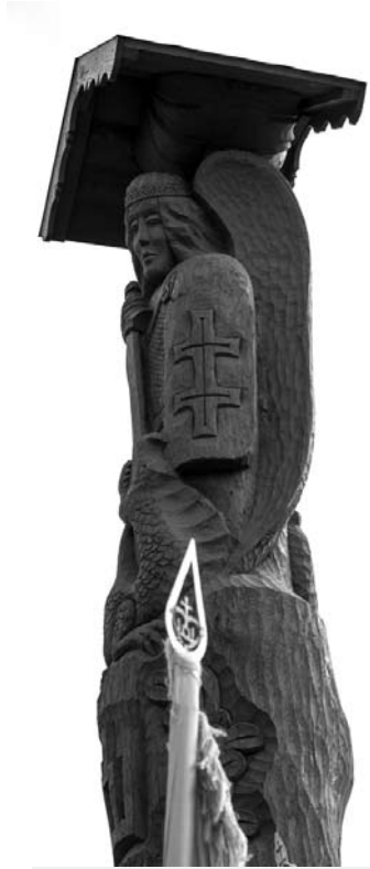
Butėnų kryžkelę papuošė tautiniais simboliais papuoštas karių ir teisiųjų globėjo Šv. arkangelo Mykolo stogastulpis.

Aidėjo patriotinės giesmės, skambėjo tauriausi žodžiai, saliuotavo skautai, pagarbą teikė jaunieji šauliai, didžiųjų pilietinių dorybių vardan dundėjo senovinės patrankos salvės, o sodyboje „Barono vila“ vyko istorinė konferencija „Ir tada buvo Žalgiris...“