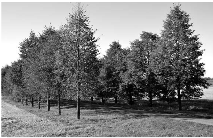
120-ies liepų alėja pamažu jau keičia savo spalvą.

Dar beveik žaliais, vos tik truputį gelsti pradėjusiais lapais ažuolas- galiūnas, augantis Tumų sodybos vietoje už akmens ir metalo konstrukcijų tvoros, visai šalia Vaižganto biusto, mane pasitiko praeitą savaitę. Aplinkui mėtėsi šiek tiek gilių, bet nedaug, ankstesniais metais jomis būdavo beveik nuklota žemė po ažuolu. Visai dar žali, pirmųjų šalnų nepakasti lapai puošė ir šalia automobilių stovėjimo aikštelės augančių obelių. Audros nu-laužė obels viršūnę, atrodė, kad medžiui atėjo liūdna baigtis. Betgi neobelis liko gyva, toliau žaliuoja, tik-tai