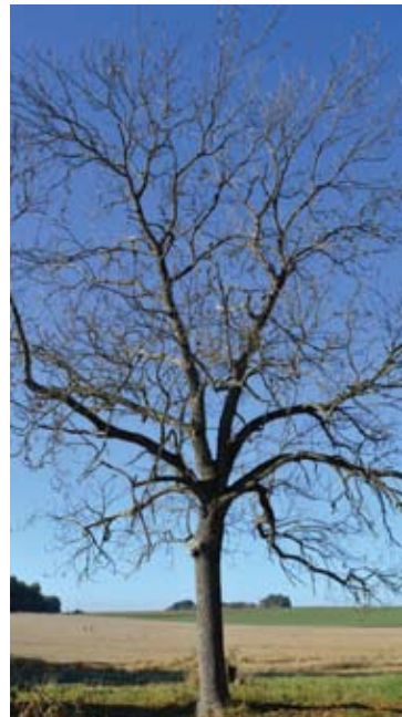
Vienas pirmųjų lapų neteko didžiulis uosis, augantis Malaišių sodžiaus pradžioje.

Rudeniškomis spalvomis kaskart vis labiau nusidažo etnografinio Malaišių kaimo, esančio Svėdasų seniūnijos pakraštyje, apylinkės.