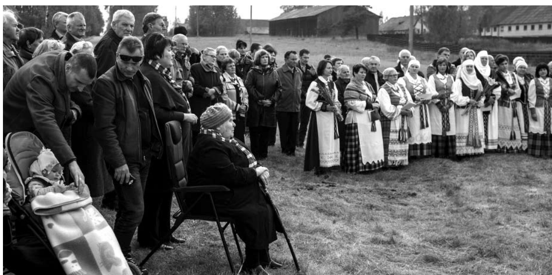
Tiek žmonių seniai nematė Butėnų ulyčia.