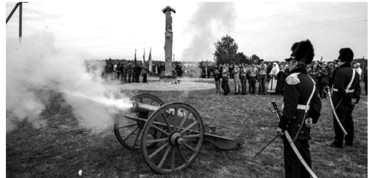
Salvės už partizanus.

Už miško palengva leidosi saulė, leidosi į širdis ir pajauta - jauku, ramu mums Lietuvoj.