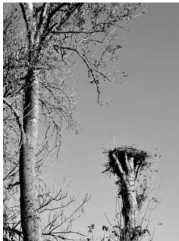
Ištuštėjo gandrallizdis prie Nakučių sodybos.