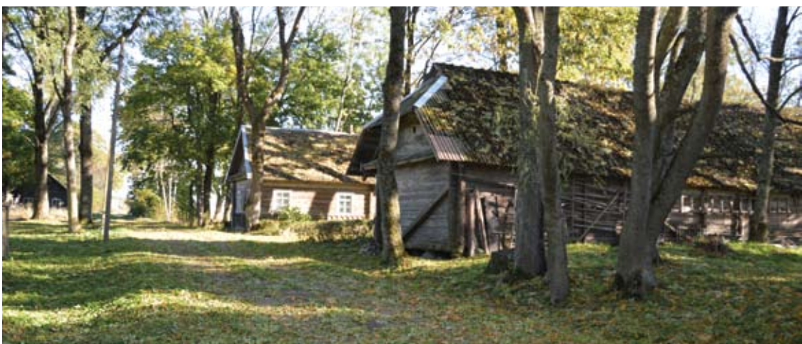
Storai nuklotas medžių lapais kelias per Malaišių „ūlyčių“, tik tai vieni medžiai dar tebežaluoja, kiti jau stirkso pliki.