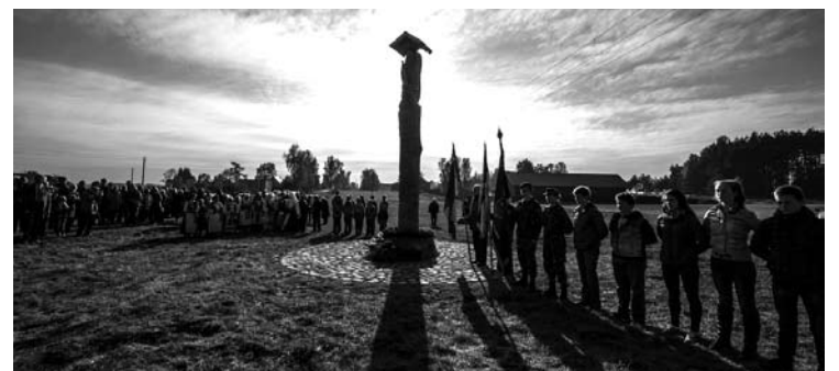
Paminklo atidarymo iškilms sutraukė ir jaunų žmonių.