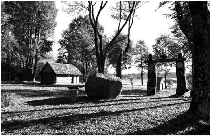
Tipiškas rudens vaizdelis Malaišiuose: aplinkui tylu, ramu, tik-tai daugėja medžių lapų.